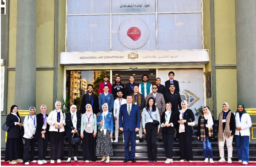
مشاركة المعهد في برامج تدريبية لمكافحة الفساد والحوكمة