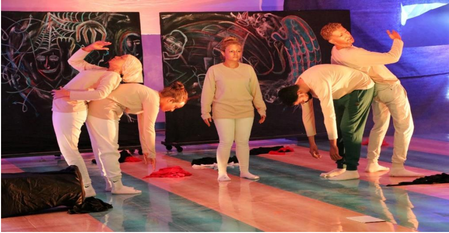
مشاركة المعهد في مسرحية الفصل الواحد